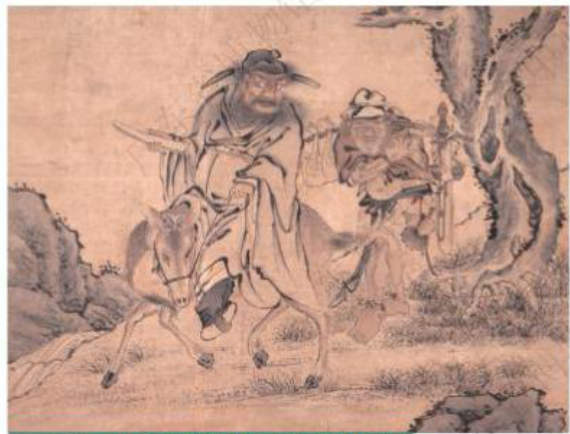
清·沈铨 - 《钟馗出游图轴》 - 广东省博物馆藏

钟馗形象缘起的各种说法，最广为人知的是被废黜的进士钟馗帮睡梦中的唐明皇抢回宝物，吞噬偷盗的小鬼。唐明皇醒来后，向画师吴道子描述梦中人，吴道子根据唐明皇的梦境画出了钟馗的相貌，从此成为鞭笞奸邪、祛除不祥的典型。