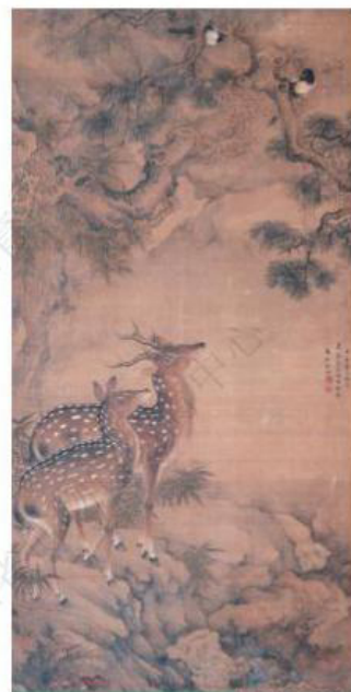
清·沈铨-《福禄图轴》 -广东省博物馆藏

红蟹配美酒，肥鱼置其中，皆为重阳应节食材，背后还有几朵菊花，突显了秋季特色。题跋中“叫西屏又唤南邻，大家拍手饮三巡。庆重阳无雨，欢喜一冬晴”表达了画家在重阳节的欢喜之情。