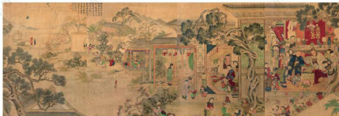
清·朱鼎新 - 《新年景图轴屏》 - 广东省博物馆藏

过大年总是让人有种热闹的感觉,下面的这幅通景屏也展示了新春时节大人家过年的盛景。