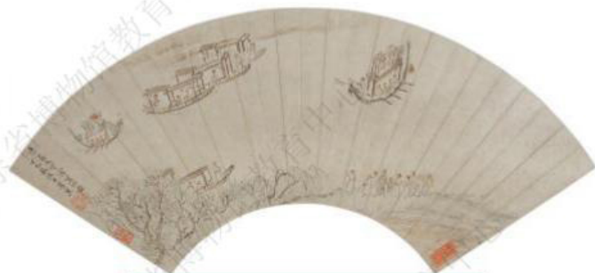
清·居廉 - 《赛龙舟扇面》 - 广州艺术博物院藏

两幅扇面图均描绘了当时热闹非凡的龙舟竞渡场面。人们除了会站在岸边观看，还会租船到江中近距离观看龙舟赛事，或敲锣打鼓、或呐喊助威、或相谈甚欢，一派热火朝天的夏日景象。