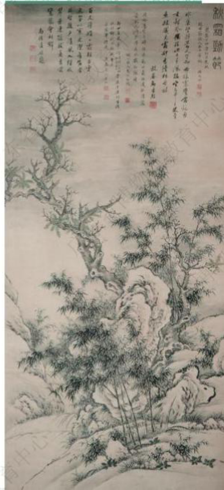
清·顾文渊-《竹石图轴》-广东省博物馆藏

《洗象图》常在浴佛节创作，学者认为画家以大象之“象”暗喻佛像之“像”，不仅仅是有“扫相”的祥意，还具有了佛教中的“浴佛”内涵，具有暗喻修行的双关寓意。