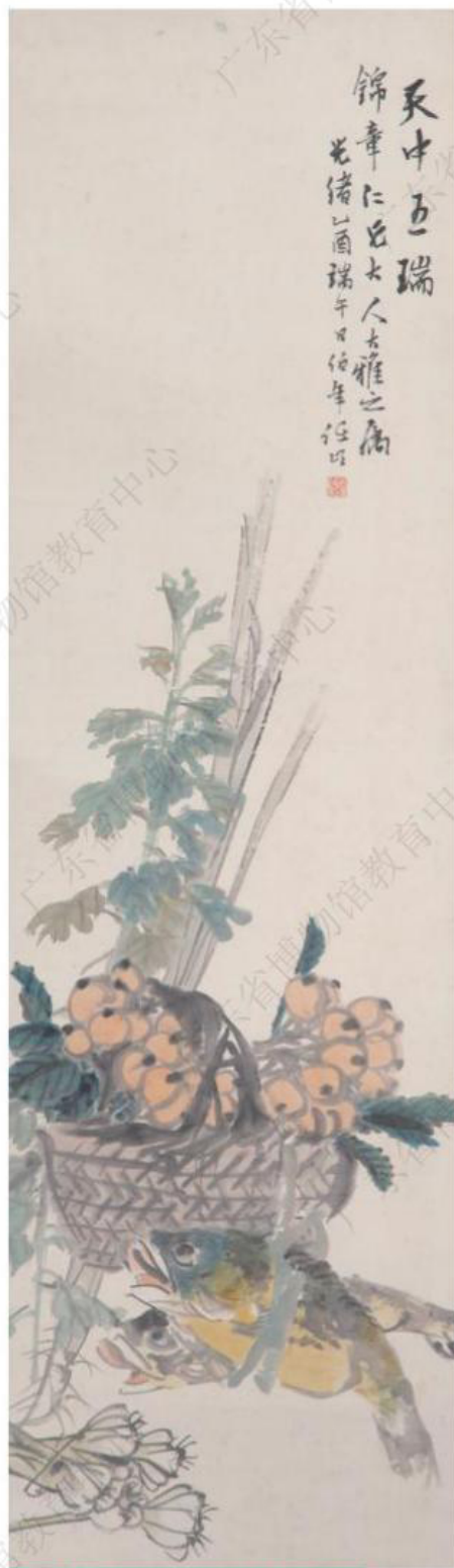
清·任颐 - 天中五瑞图 - 广东省博物馆藏

天中指的是端午节，因为古人认为一三五七九为阳数，五在它们中间，而且午时太阳最高、阳气最旺，所以五月五日午时称为“天中”。