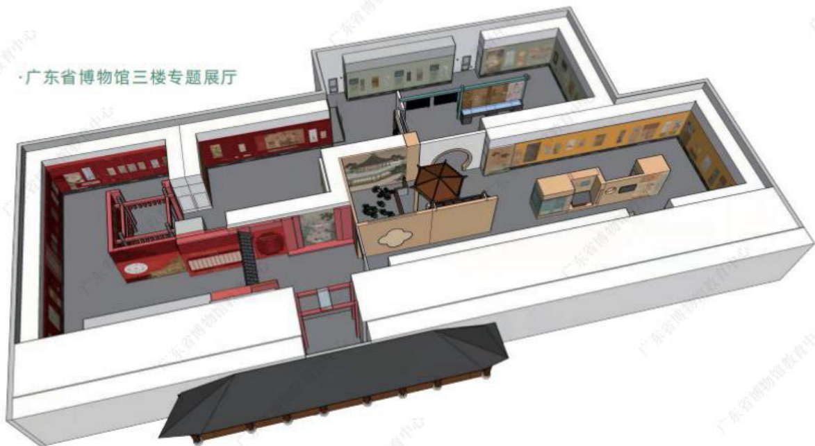
·广东省博物馆三楼专题展厅