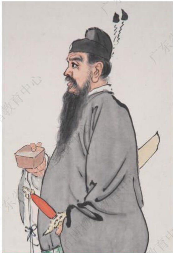
现代·徐悲鸿 - 《钟进士图轴》 - 广东省博物馆藏

长盛不衰的钟馗主题画作反映了人们对钟馗的喜爱，其容貌、形象世俗化的趋势也反映了钟馗历年来的流变。相比前代画家笔下的钟馗，其凶恶、丑陋的特征已逐渐淡化，变得更贴近普通人的容貌，更具生活气息。