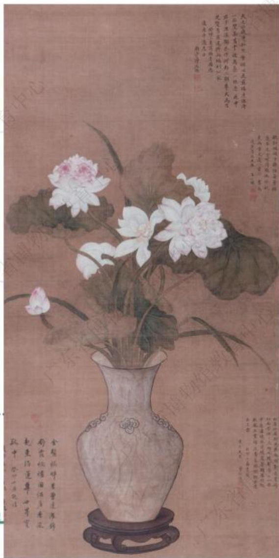
清·蒋廷锡 - 《瑞莲图轴》 - 广东省博物馆藏

这幅画以并蒂莲花为主题,莲出淤泥而不染,是古人眼里高洁的象征,“并蒂”意为永结同心。而花瓶的“瓶”音同平安的“平”,花瓶上有冰裂纹样,像碎了一样,取谐音,两者结合即为“岁岁平安”。整幅画寓意祥瑞,非常符合人们在新的一年里对未来的美好期盼。