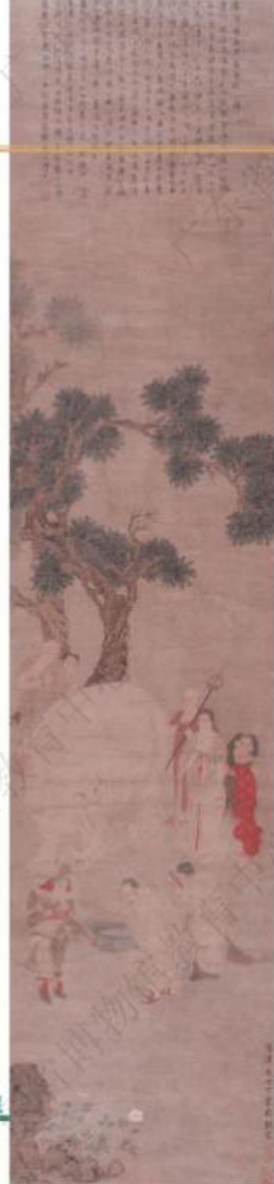
明·丁云鹏-《洗象图轴》-广东省博物馆藏

《洗象图》常在浴佛节创作，学者认为画家以大象之“象”暗喻佛像之“像”，不仅仅是有“扫相”的祥意，还具有了佛教中的“浴佛”内涵，具有暗喻修行的双关寓意。