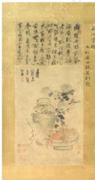
明·徐潜-《重阳清趣图轴》 -广州艺术博物院藏

红蟹配美酒，肥鱼置其中，皆为重阳应节食材，背后还有几朵菊花，突显了秋季特色。题跋中“叫西屏又唤南邻，大家拍手饮三巡。庆重阳无雨，欢喜一冬晴”表达了画家在重阳节的欢喜之情。