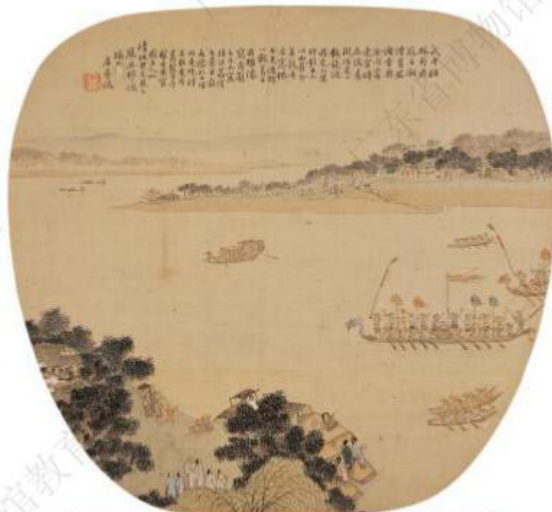
清·居廉 - 《龙舟竞渡扇面》 - 广州艺术博物院藏

两幅扇面图均描绘了当时热闹非凡的龙舟竞渡场面。人们除了会站在岸边观看，还会租船到江中近距离观看龙舟赛事，或敲锣打鼓、或呐喊助威、或相谈甚欢，一派热火朝天的夏日景象。