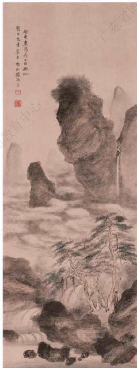
近代·赵浩-《山水图轴》-广东省博物馆藏

春来踏青，秋去辞青。金秋九月，气候宜人，天朗风清，人们在山水自然之间共赏秋色，吟诗作对，既能享受节日的喜乐，又展现出了古人的浪漫与趣味。与此同时，画家以重阳节为主题也留下了许多佳作。