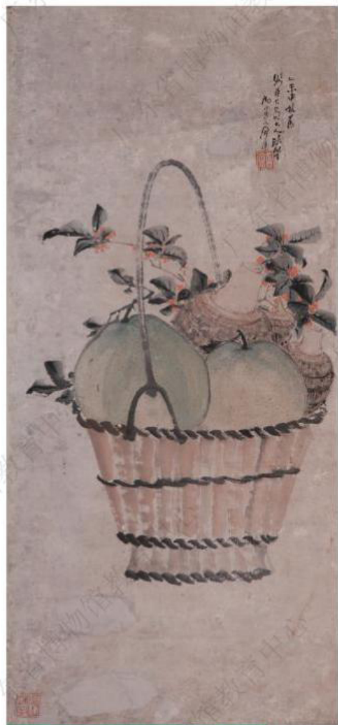
清·居廉-《秋实图轴》-广东省博物馆藏

在广东地区，节日食物方面除了吃月饼以外，还会吃芋头、吃柚子、炒螺等。清代《羊城竹枝词》中就有所提及：“中秋佳节近如何，饼饵家家馈送多，拜罢嫦娥斟月下，香芋啖遍更炒螺”，体现了清代广州地区中秋佳节家万户的饮食风俗。