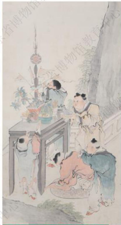
清·任薰-《拜月图轴》-广东省博物馆藏

古时的人们对自然有着崇拜与敬畏之心，中秋节就源自于对月亮的崇拜。故在中秋节这天，拜月也成为节日的一项重要民俗活动。画中的小人有的在将贡品摆放在案桌上，有的跪在蒲团上祭拜祈福，有的悄悄伸长小手向瓜果进发……画中人物动作丰富、惟妙惟肖，构建出颇具趣味的中秋景象，也展现出了当时人们有祭拜月亮的习俗。